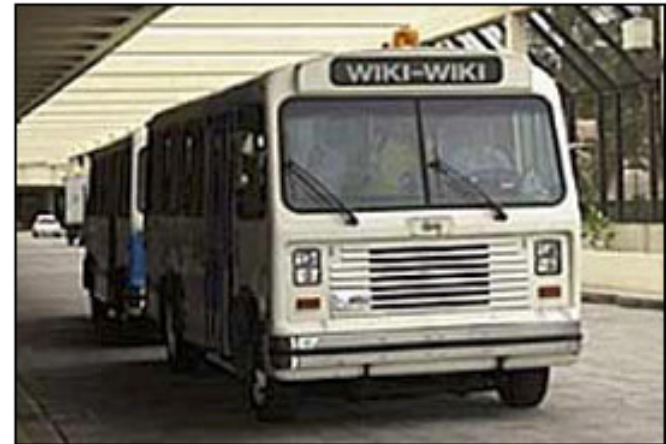
Wiki Wiki Cab, Hawaii